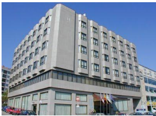
Hotel Tryp Los Galeones

CEPA Asociación Espírita Internacional y AIPE Asociación Internacional para el Progreso del Espiritismo, a través de sus Asociaciones, están trabajando en la organización del III Encuentro Espírita Iberoamericano que bajo el lema “Cultura Espírita – Una Contribución al Progreso de la Humanidad” tendrá lugar los días 28, 29 y 30 de abril de 2018, en la ciudad de Vigo (Pontevedra – Galicia). El precio de inscripción sólo al