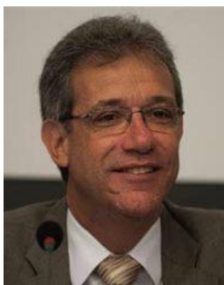
Ademar Arthur Chioro dos Reis