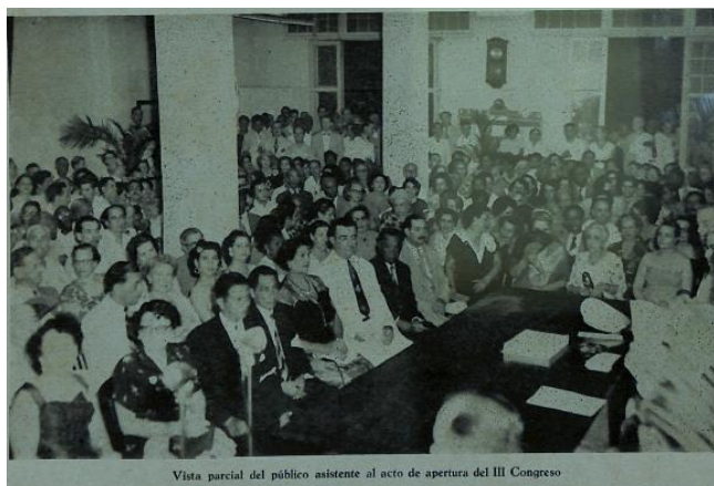
Vista parcial del público asistente al acto de apertura del III Congreso

Asumieron la responsabilidad de organizar este evento, la Confederación Nacional Espiritista de Cuba, integrante de CEPA y la Unión de Mujeres Espiritistas de Cuba, afiliada a CEPA quedando constituida la Comisión organizadora del III Congreso Espírita Panamericano de la siguiente forma: